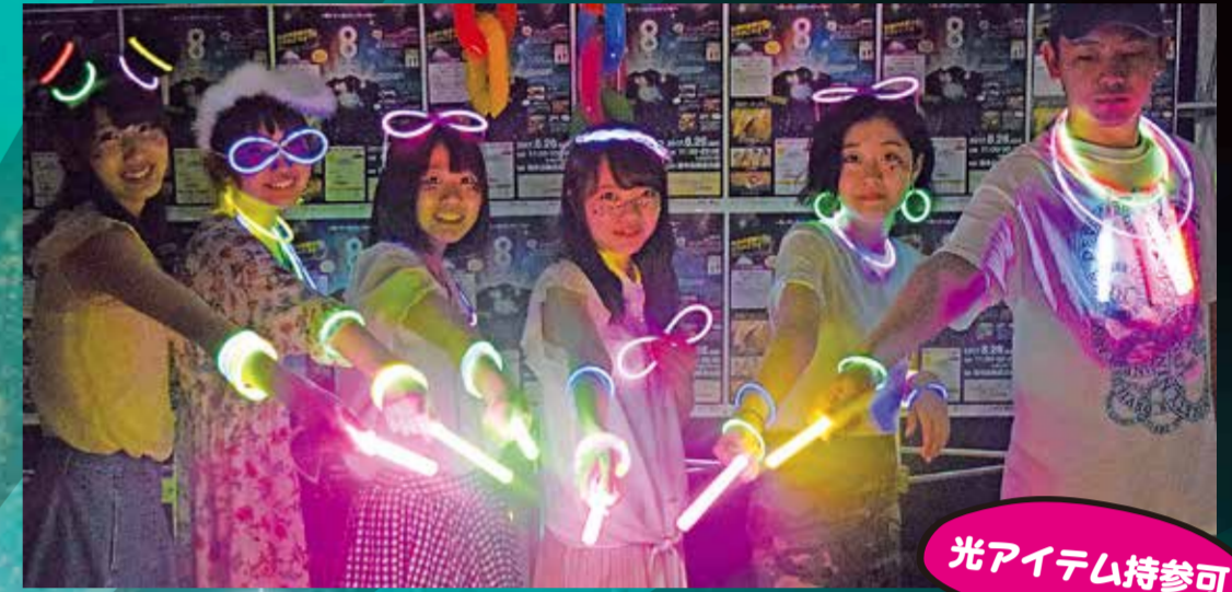
光アイテム持参可